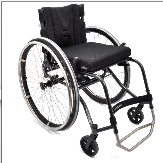
Panthera S3 S3, S3 kort, S3 kort-låg, S3 large