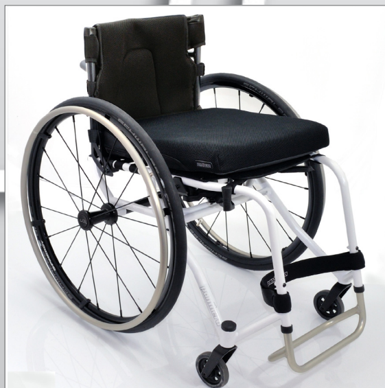
Panthera U3 Light / L