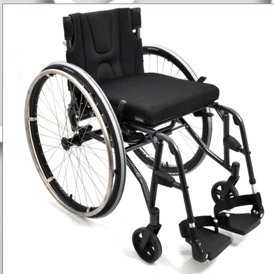
Panthera S3 Swing S3 Swing, S3 Swing-kort